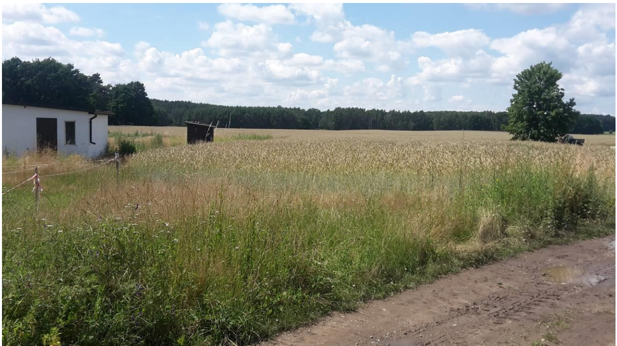
Abb. 6: Blick entlang des nördlichen Randes nach Osten auf die Feldflur (Foto: 12.07.2021).