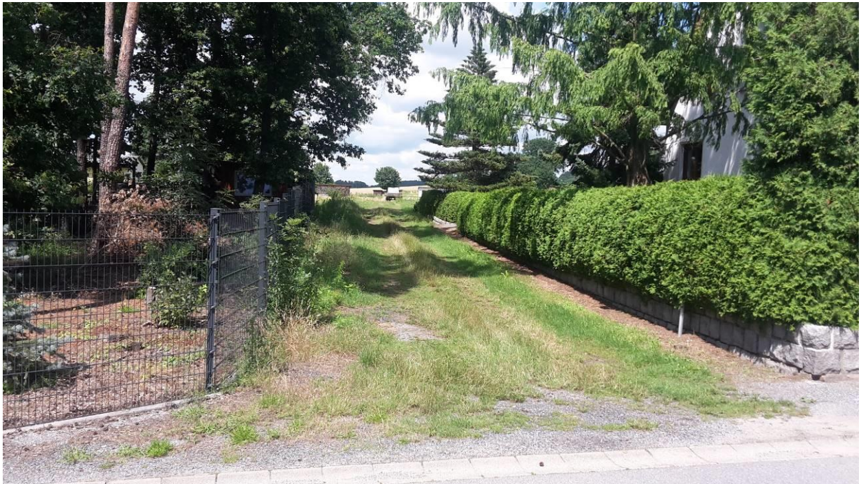
Abb. 3: Blick von der Sportplatzstraße nach Norden entlang der vorhandenen Zuwegung zum geplanten Baugebiet (Foto: 12.07.2021)