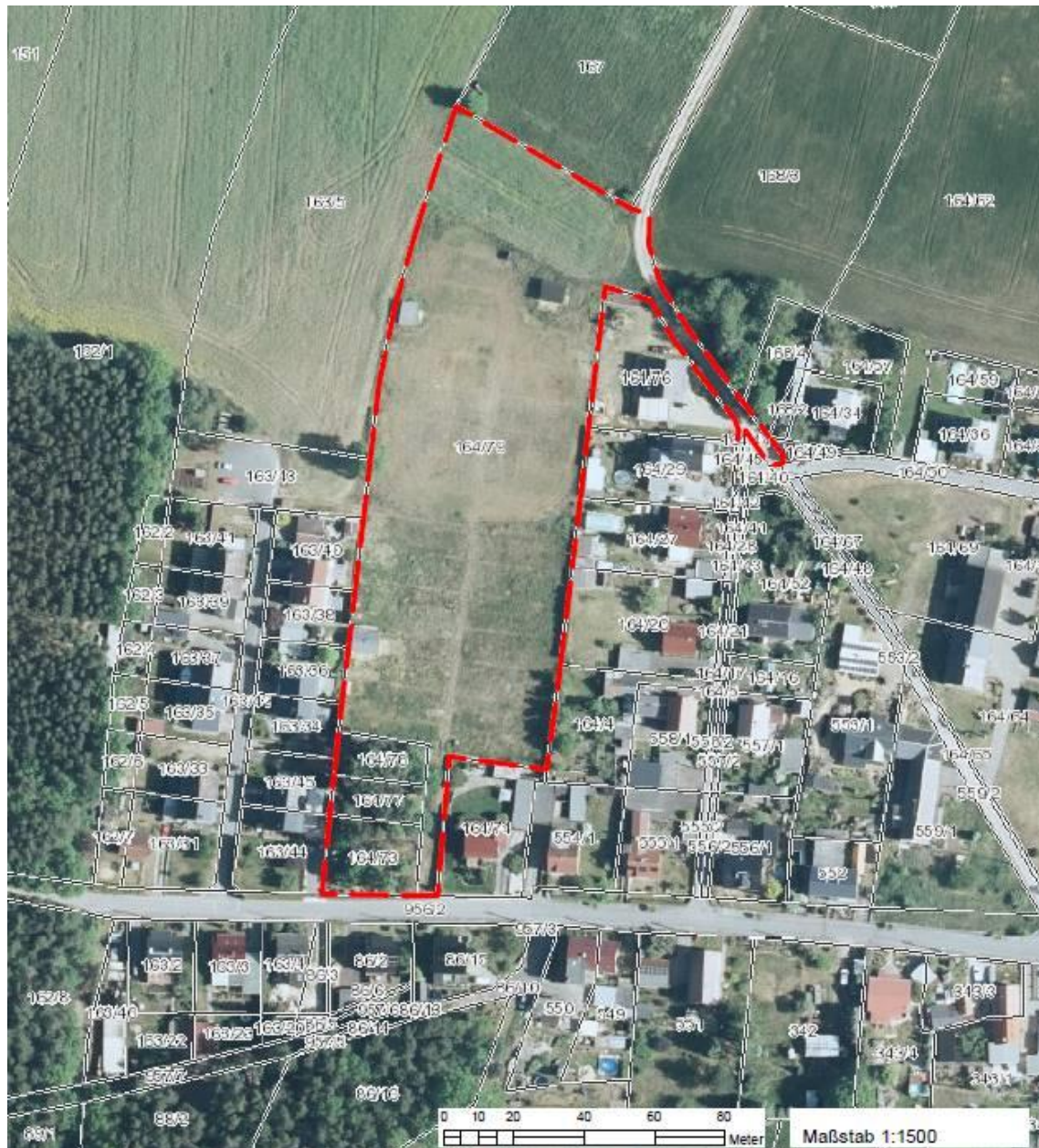
Abb. 1: Lage des Vorhabens (rot: Grenze des Betrachtungsbereiches), Quelle Luftbild: geoportal.sachsen.de

Der Betrachtungsbereich (=Untersuchungsgebiet bzw. Untersuchungsraum) entspricht weitgehend dem vorgesehenen Geltungsbereich des B-Planes. Damit wurde ein Bereich erfasst, der den möglichen Wirkraum des Vorhabens ausreichend umfasst.