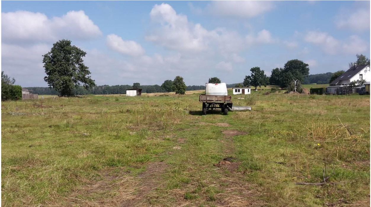
Abb. 9: Blick über das B-Plan-Gebiet nach Norden (Foto: 02.09.2021)