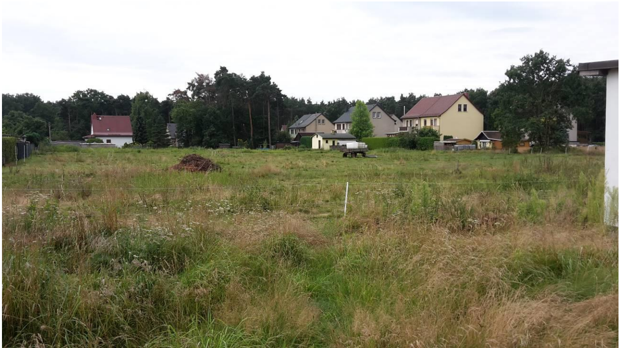
Abb. 7: Blick über das B-Plan-Gebiet nach Süden (Foto: 04.08.2021)