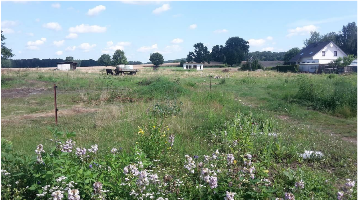
Abb. 2: Blick von Süden auf die Fläche, wo sich im nördlichen Bereich noch zwei alte Gartenlauben befinden (Foto: 27.07.2021)

Insgesamt ist die Fläche durch junge Sukzessionsflächen von Grünland, Reste von Gartenflächen und Blumenrabatten sowie Ruderalflächen gekennzeichnet, Gehölze sind in der Fläche nicht vorhanden. Das Gebiet ist somit im östlichen und südwestlichen Bereich von vorhandener Wohnbebauung umgeben, so dass der Vorschlag für die Bebauung mit Einfamilien-Häusern zu einer Abrundung der vorhandenen Ortsgrenzen beitragen wird.