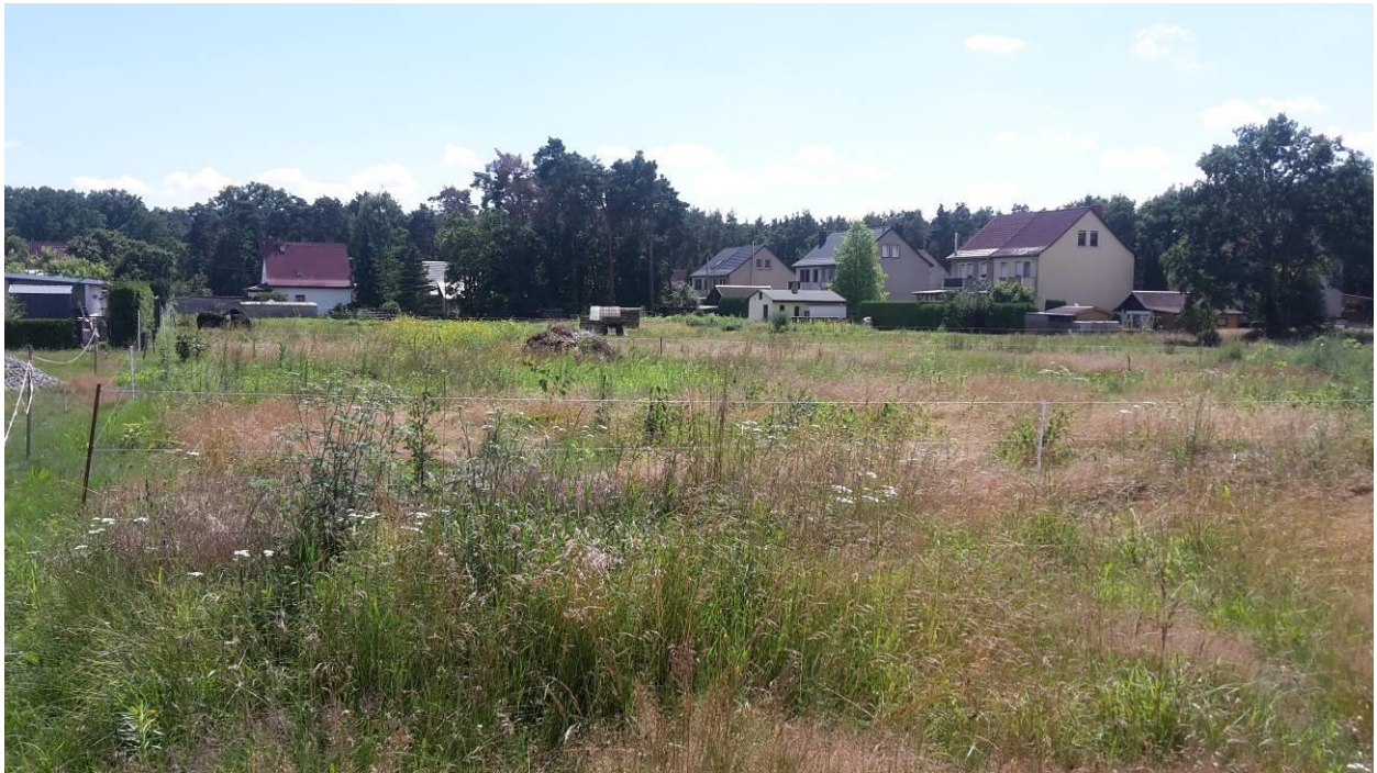
Abb. 5: Blick über das B-Plan-Gebiet nach Süden (Foto: 12.07.2021)