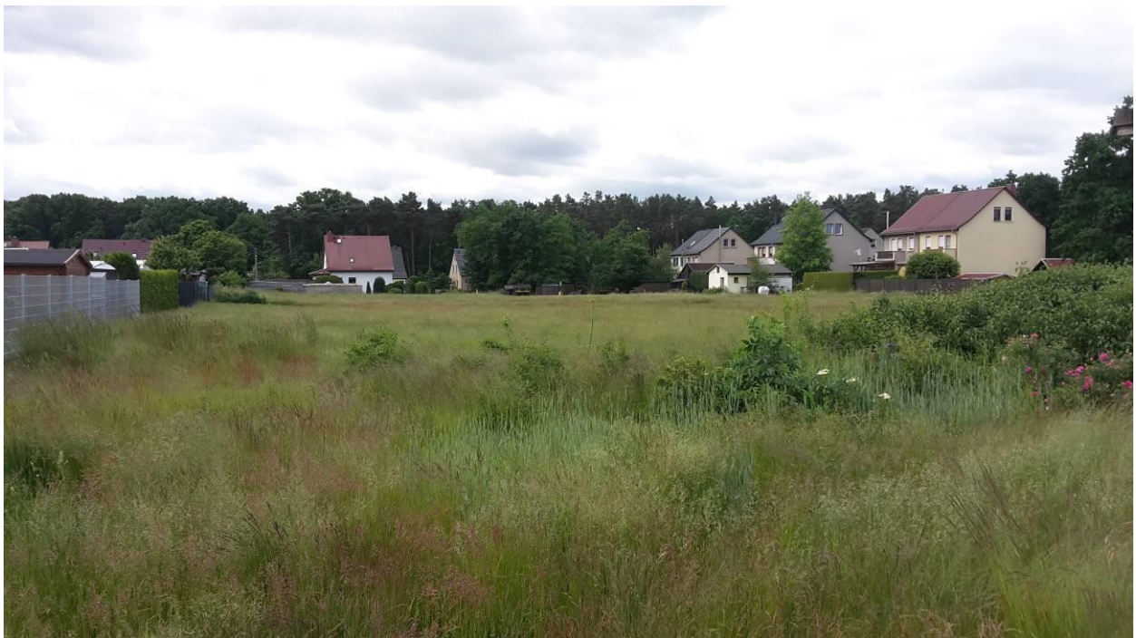
Abb. 8: Blick über das B-Plan-Gebiet nach Süden (Foto: 06.06.2025)